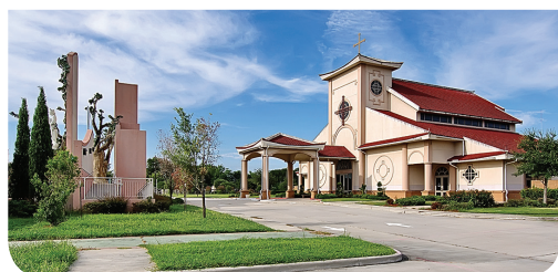
GIÁO XỨ ĐỨC MẸ LA VANG - WWW.LAVANGCHURCH.ORG

Sự hiện diện mới của Đức Kitô làm cho chúng ta suy nghĩ về hiện trạng về thế giới hôm nay, đặc biệt là nạn đại dịch Covid-19. Đã một năm qua từ ngày thế giới bị chao đảo về nạn đại dịch toàn cầu. Tưởng chừng như nạn đại dịch này đã gây nên những trở ngại to lớn liên quan đến niềm tin của chúng ta vì không được đến tham dự thánh lễ như thường lệ. Tuy nhiên, nếu ta nhận thức được rằng, Đức Giêsu